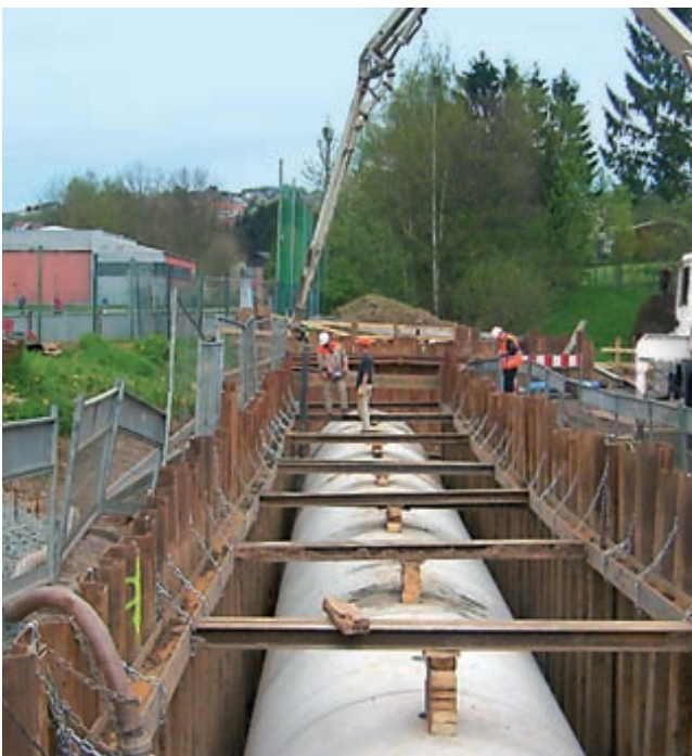
Einsatz von füma® boden bei der Einbettung von großformatigen Betonrohren

Die Qualität der Verfüllung der Leitungsgräben, insbesondere in der Leitungszone, wirkt sich unmittelbar auf das Tragverhalten der verlegten Leitungen aus und beeinflusst ihre Wechselwirkung mit dem umgebenden Baugrund. Mittelbar sind positive Auswirkungen auf Nutzungsdauer und Wirtschaftlichkeit der Investition zu erwarten.