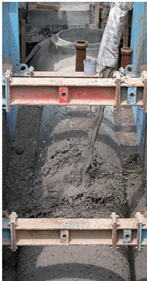
Einbau von füma® boden mittels Schlauchverlängerung