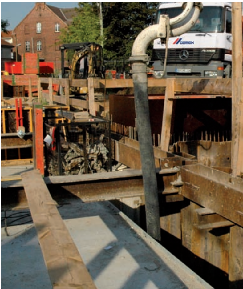
füma® boden eignet sich auch speziell als wiederaufgrabbare Arbeitsraumverfüllung

Hier bietet füma® boden die optimale Lösung. Häufig auftretende Verlegefehler und daraus mittel- bzw. unmittelbar resultierende Schadensursachen werden bei der Verwendung von füma® boden von vornherein vermieden. Die Bauzeit wird verkürzt, und erhebliche Kosten werden eingespart.