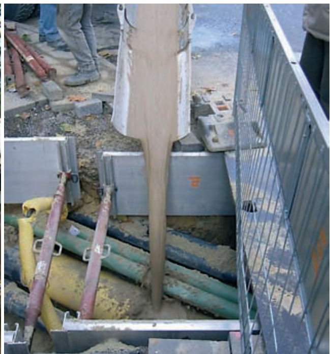
Bei einer Vielzahl von Leitungen wird der Graben optimal mit füma® boden verfüllt