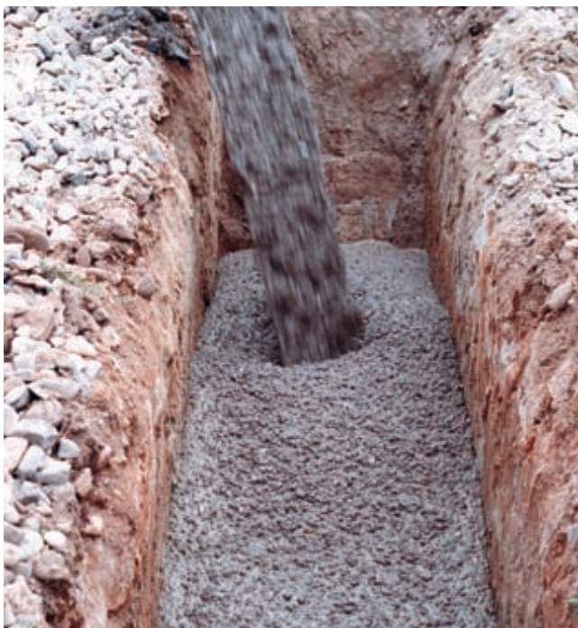
füma® rapid empfiehlt sich als Grabenverfüllung besonders dort ...

nach 2 h > 20 MN/m 2 nach 1 d > 45 MN/m 2 nach 3 d > 60 MN/m 2 nach 7 d > 150 MN/m 2 nach 28 d > 200 MN/m 2