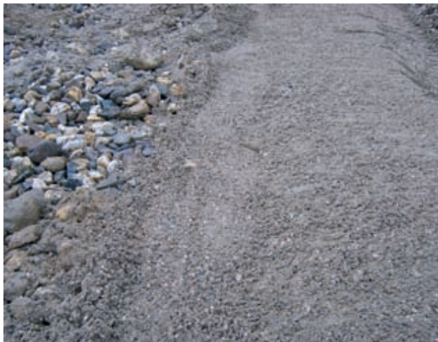
... wo eine zügige Wiederaufnahme von Fußgänger- und Straßenverkehr gefordert wird.