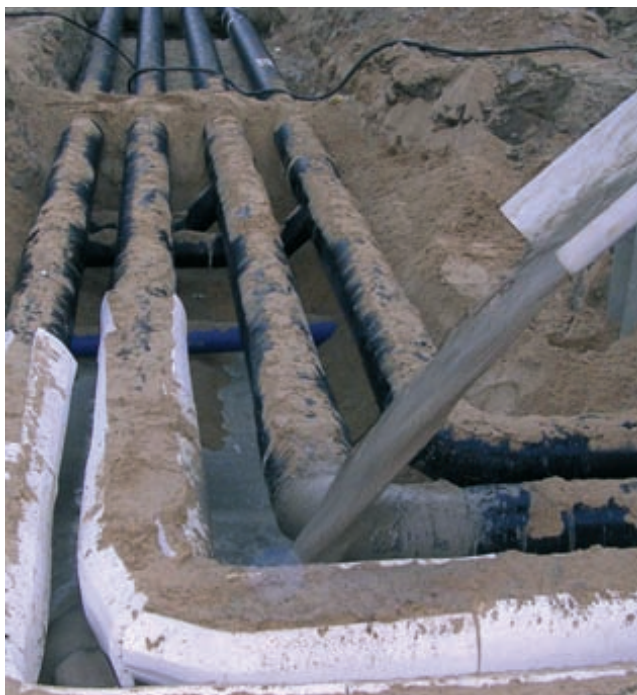
Die Eignung von füma® boden im Fernwärmeleitungsbau wurde durch das FFI Hannover bestätigt. Bericht: Untersuchungen an fließfähigem Verfüllbaustoff füma® boden zur Interaktion mit warmgehenden Leitungen, 2006