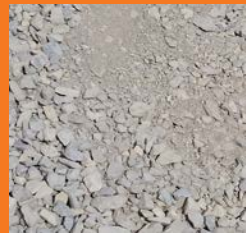
Schotter / Mineraler